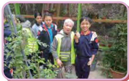
共結青織社區協作計劃 長幼互動交流活動

在社交方面，我們將嘗試發展不同類型的「運動」小組，度身訂造一些適合不同身體情況的運動項目，透過持續訓練和交流比賽，讓院友們鍛鍊身體之餘，亦能提升能力感。最後，我們也希望多些帶院友們到院舍以外進行活動，增加與社區接觸的機會。