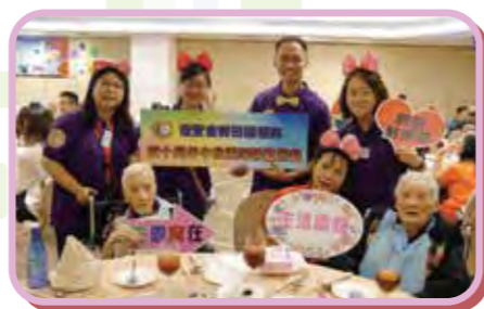
40周年中秋聯歡聚餐

2018年詩田頤養院以「承傳愛，頌主恩，詩田四十願成真」為主題，與院友及家屬透過一連串活動祝賀詩田院慶四十年，藉此延展詩田的愛和感謝神對詩田的恩典。慶祝活動包括出版40周年紀念特刊、40周年中秋團圓聯歡聚餐、40周年感恩崇拜、40周年愛回家開放日及40周年院友拍攝紀念照。