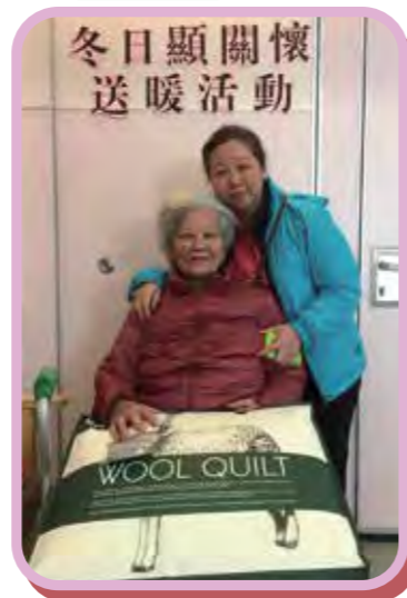
冬日顯關懷送暖行動

長者一般非常節儉，為了節省開支，家中禦寒衣物不足也不願花費添加。中心透過送暖行動和探訪，向長者表達關懷。中心總共向75名80歲或以上年長者派贈禦寒衣物，包括羽絨衣、棉被和棉襪。當中義工亦進行了40次到戶探訪，表達關懷。長者對中心所派贈的禦寒衣物都表示非常實用。