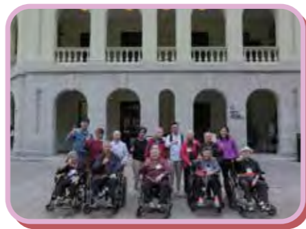
旅行-參觀中環大館