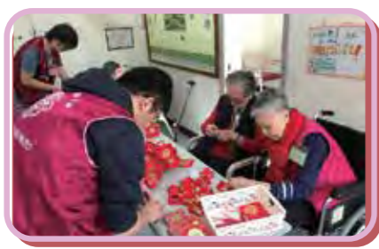
院友與義工一起 製作賀年掛飾