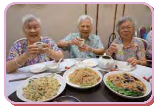
長者享受飲茶活動