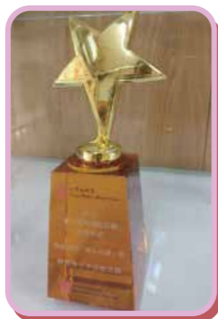
王少清頤養院在「老有所為活動計劃」獲獎

王少清頤養院獲社會福利署資助2016-2018年度的「老有所為活動計劃」，推行『關愛「腦」朋友』活動。活動培訓了社區人士，學習有關認知障礙症的知識，並進一步推動《認知友善社區》的建立。計劃除榮獲社會福利署頒發「老有所為活動計劃」兩年計劃沙田區最佳活動獎，並獲頒全港最佳活動獎亞軍。