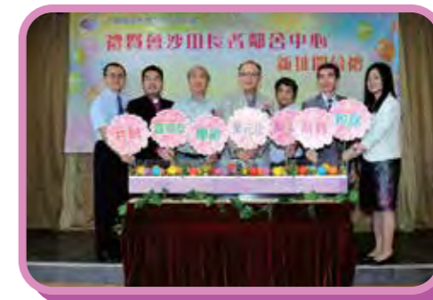
沙田長者鄰舍中心開幕儀式

沙田長者鄰舍中心自2003年成立，於沙田第一城服務接近15年，為區內的長者提供優質的服務。但由於第一城的會址空間不符合鄰舍中心的營運要求，因此中心於2017年11月遷至水泉澳邨，新址有4000呎，為長者提供了充足而舒適的活動空間。中心於2018年5月19日舉行新址開幕禮，當天由社會福利署助理署長陳德義先生、沙田區區議會主席何厚祥先生及房屋事務經理馬耀池先生擔任主禮嘉賓，出席嘉賓超過90多位，一同支持中心展開新一頁。