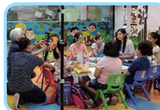
微电影小學組拍攝情況