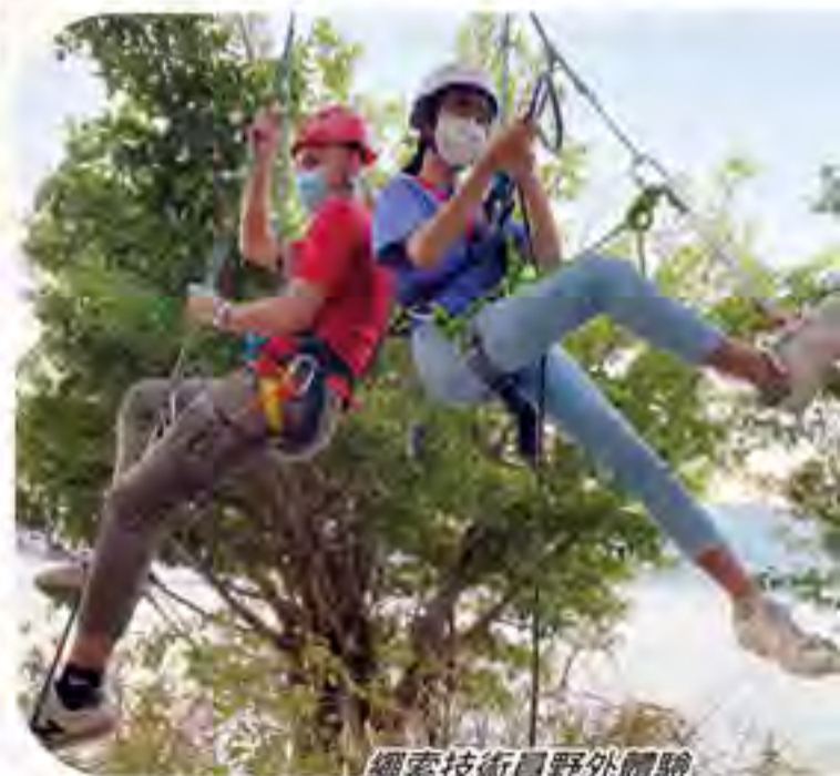
繩索技術員野外體驗