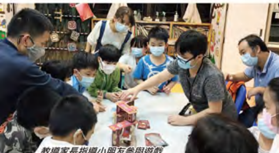
教導家長指導小朋友參與遊戲