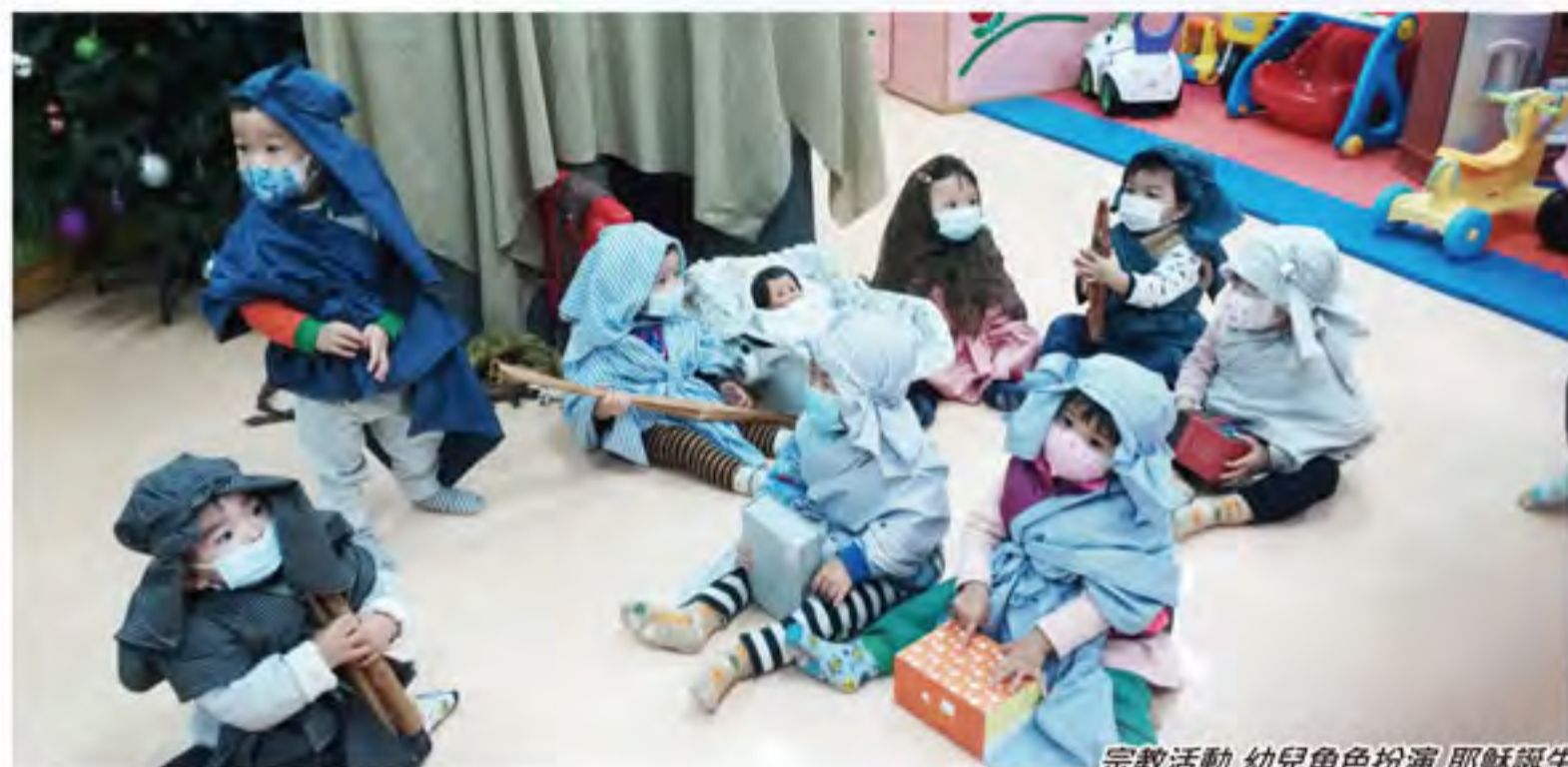
宗教活動 幼兒角色扮演 耶穌誕生