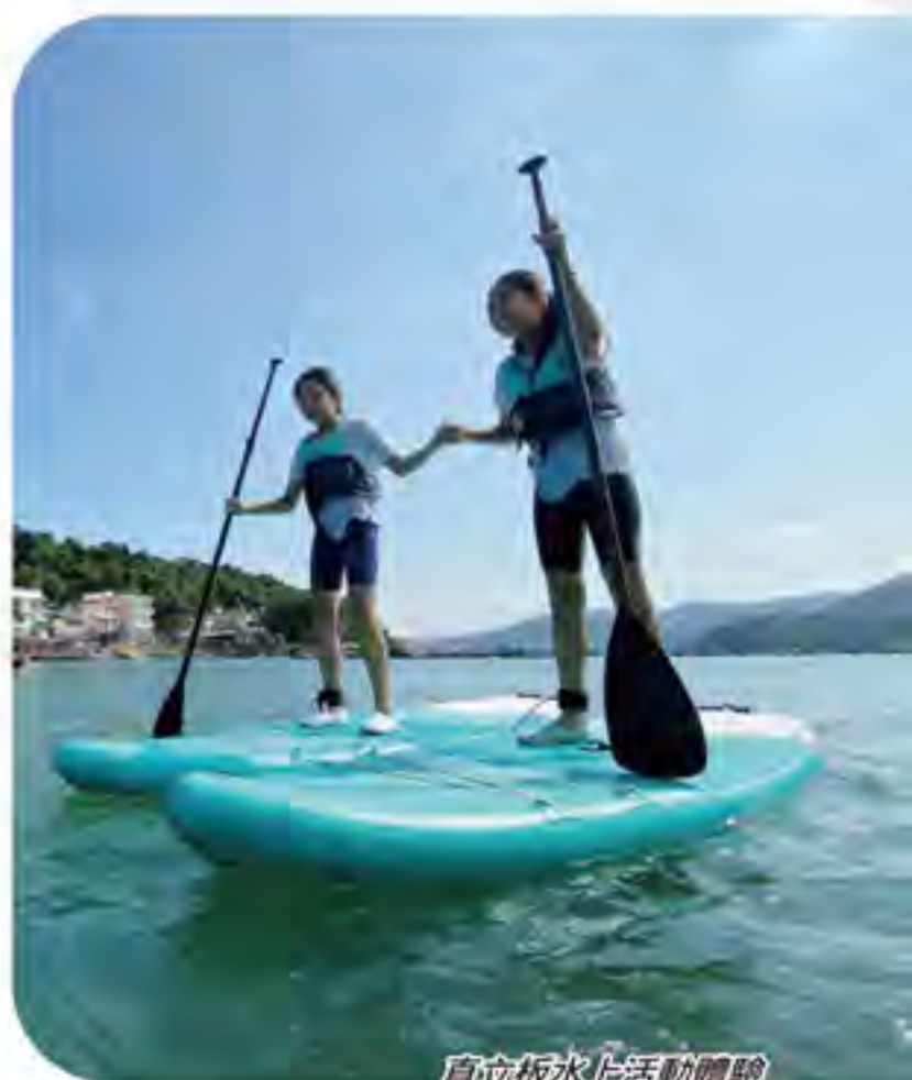
直立板水上活動體驗