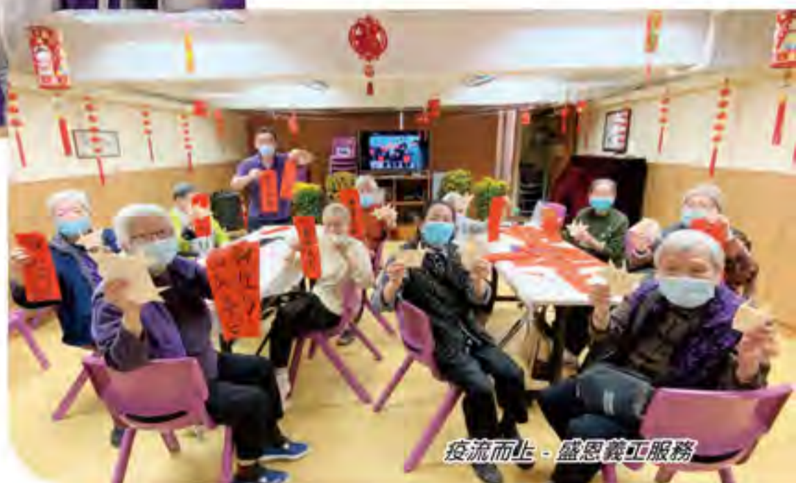
疫流而上 - 感恩義工服務