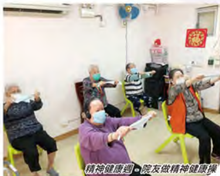
精神健康週 - 院友做精神健康操