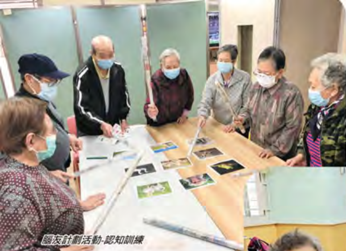
老友計劃活動-認知訓練