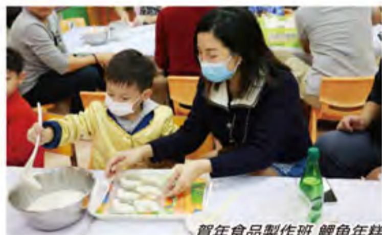
賀年食品製作班 鯉魚年糕