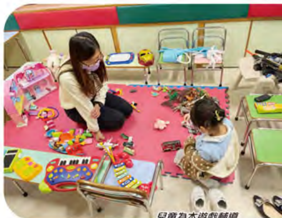
兒童為本遊戲輔導