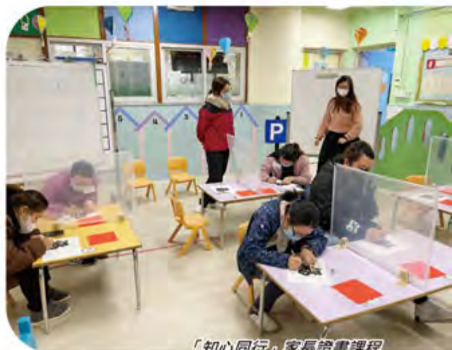
「知心同行」家長證書課程