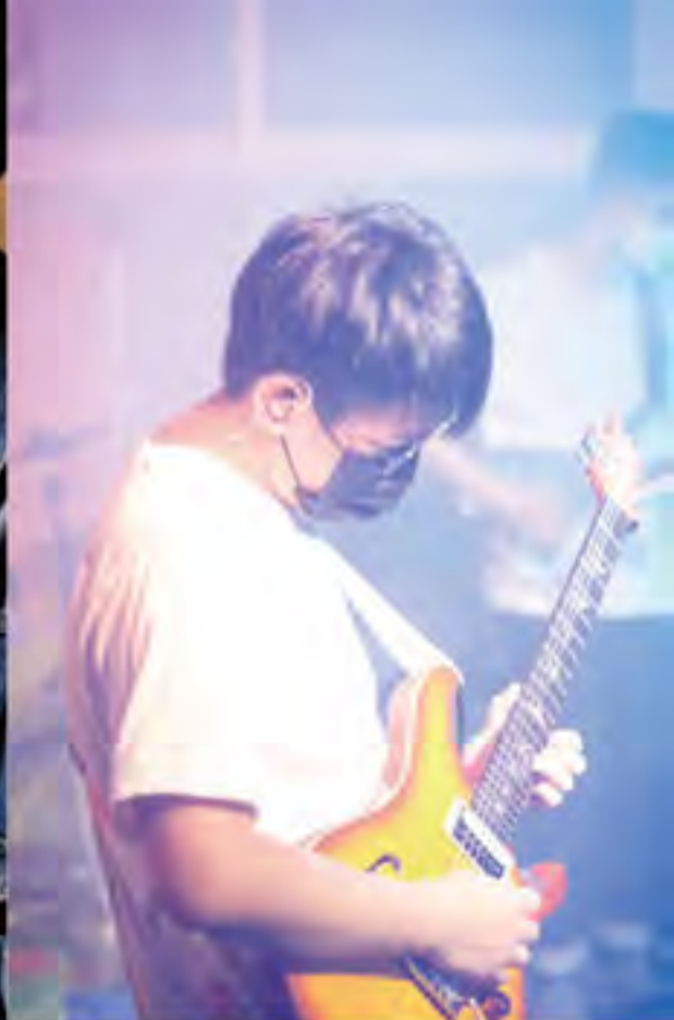
Mini Bandshow (網上直播)