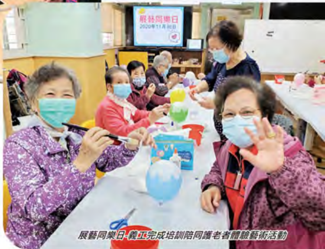
展藝同樂日-義工完成培訓陪同護老者體驗藝術活動