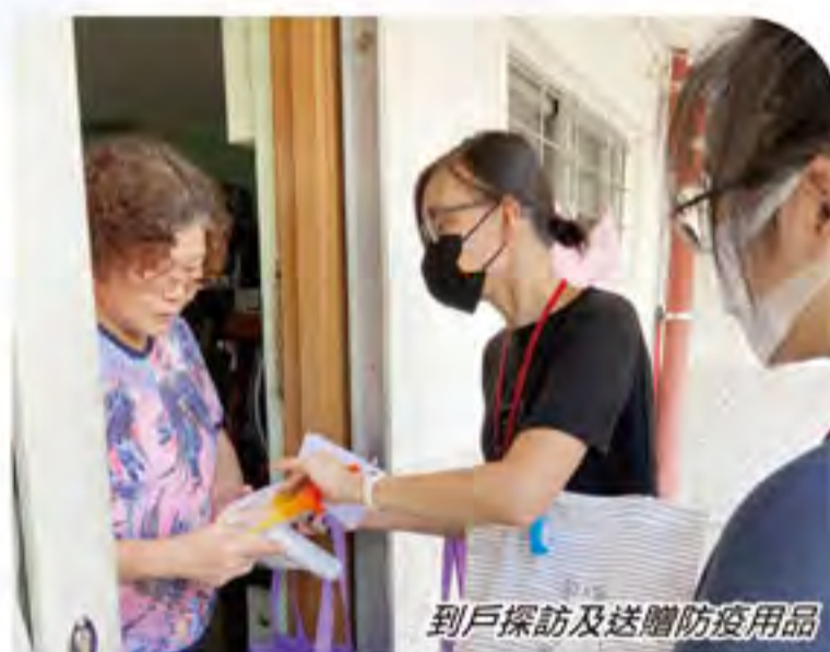
到戶探訪及送贈防疫用品