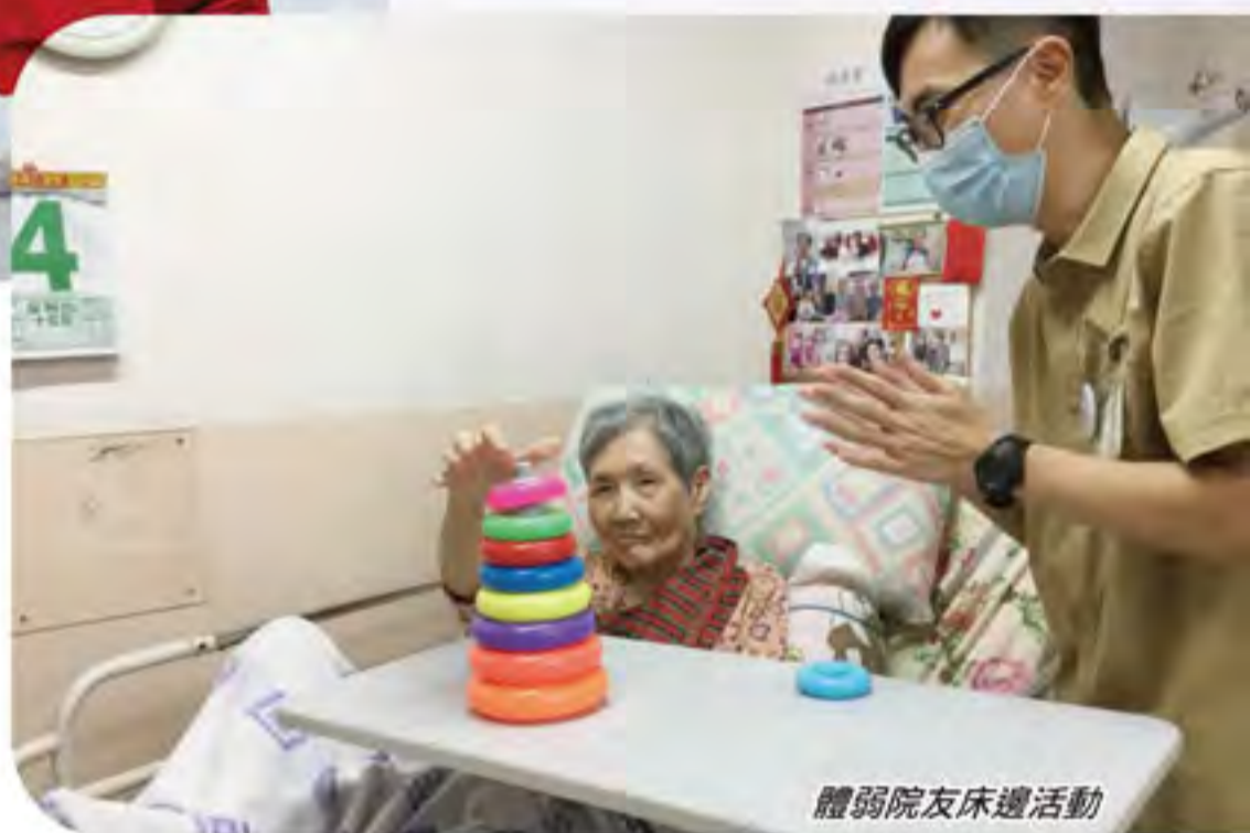
體弱院友床邊活動