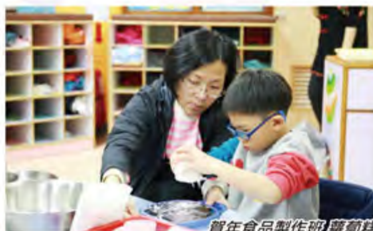
賀年食品製作班 蘿蔔糕