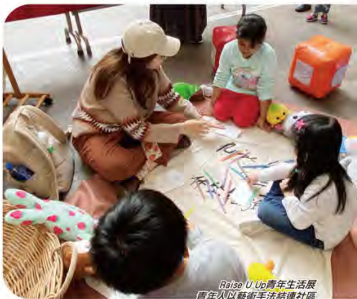
Raise U Up青年生活展 青年人以藝術手法結連社區

2021年，中心會繼續關注兒童及青少年的精神健康及人際關係，同時希望透過推行創客教育(Maker Education)，鼓勵青少年富創意、動手造，關懷及改善社區。另外，同工會作出裝備，靈巧應變，為受眾提供最好的服務！