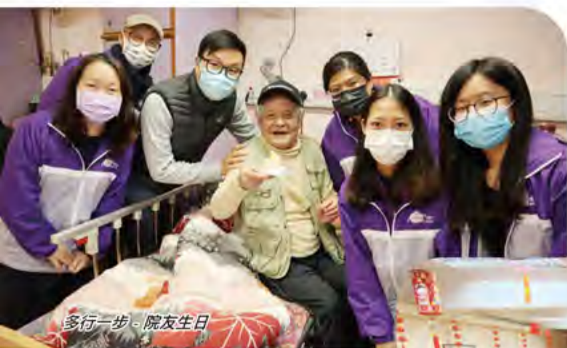
多行一步 - 院友生日

未來一年仍會受新冠肺炎的疫情影響，兩間頤養院會不斷按疫情作出應變，盡力增加院友社交的機會及與家人的聯繫。各職級同事會繼續同心，給予院友更多身、心、靈的關顧，亦會努力在臨終照顧服務上做得更好。