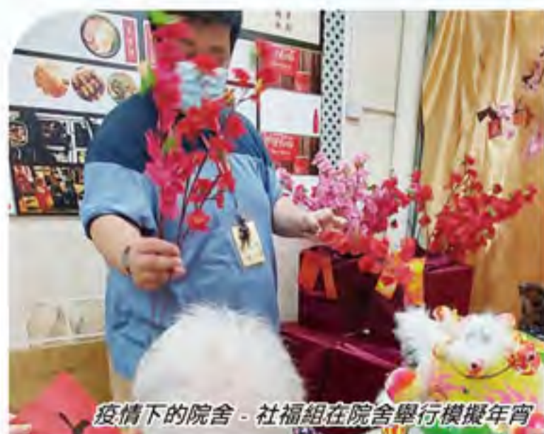
疫情下的院舍 - 社福組在院舍舉行模擬年宵