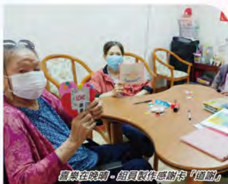
喜樂在晚晴 - 組員製作感謝卡「道謝」