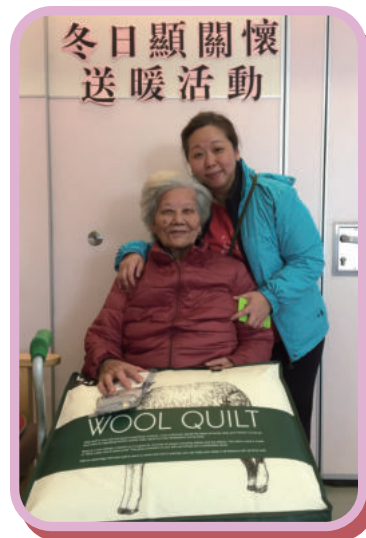
冬日顯關懷送暖行動

長者一般非常節儉，為了節省開支，家中禦寒衣物不足也不願花費添加。中心透過送暖行動和探訪，向長者表達關懷。中心總共向75名80歲或以上年長者派贈禦寒衣物，包括羽絨衣、棉被和棉襪。當中義工亦進行了40次到戶探訪，表達關懷。長者對中心所派贈的禦寒衣物都表示非常實用。