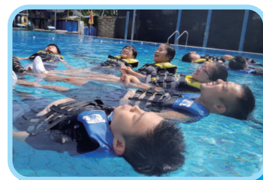
Super Hero Camp_水上歷奇活動