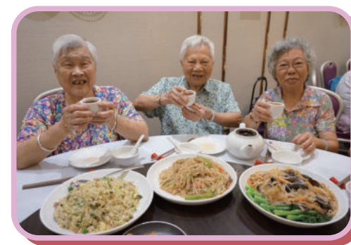
長者享受飲茶活動