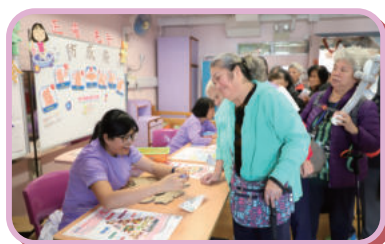
詩田頤養院開放日