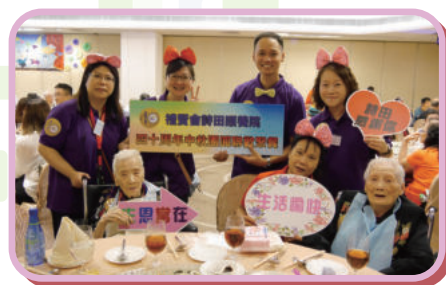
40周年中秋聯歡聚餐

2018年詩田頤養院以「承傳愛，頌主恩，詩田四十願成真」為主題，與院友及家屬透過一連串活動祝賀詩田院慶四十年，藉此延展詩田的愛和感謝神對詩田的恩典。慶祝活動包括出版40周年紀念特刊、40周年中秋團圓聯歡聚餐、40周年感恩崇拜、40周年愛回家開放日及40周年院友拍攝記念照。