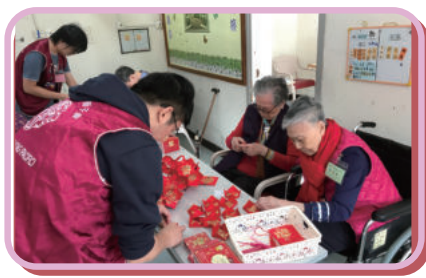
院友與義工一起 製作賀年掛飾