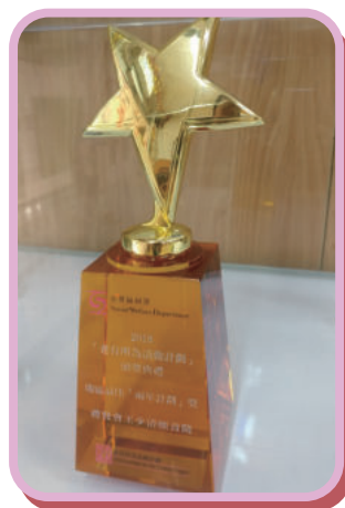
王少清頤養院在「老有所為活動計劃」獲獎

王少清頤養院獲社會福利署資助2016-2018年度的「老有所為活動計劃」，推行『關愛「腦」朋友』活動。活動培訓了社區人士，學習有關認知障礙症的知識，並進一步推動《認知友善社區》的建立。計劃除榮獲社會福利署頒發「老有所為活動計劃」兩年計劃沙田區最佳活動獎，並獲頒全港最佳活動獎亞軍。