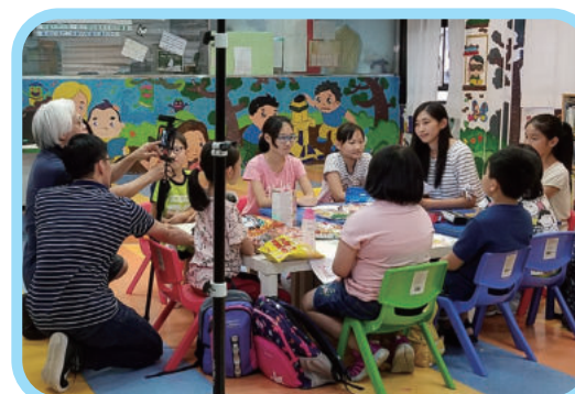
微電影小學組拍攝情況