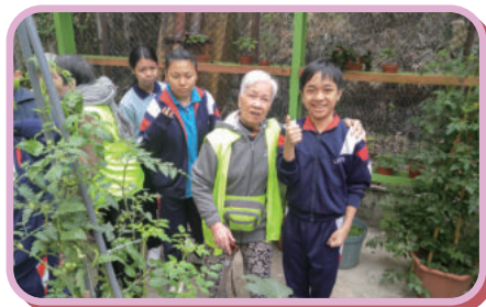
共結耆慈社區協作計劃 長幼互動交流活動

在社交方面，我們將嘗試發展不同類型的「運動」小組，度身訂造一些適合不同身體情況的運動項目，透過持續訓練和交流比賽，讓院友們鍛鍊身體之餘，亦能提升能力感。最後，我們也希望多些帶院友們到院舍以外進行活動，增加與社區接觸的機會。