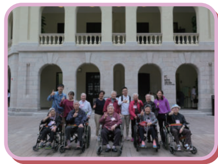
旅行-參觀中環大館