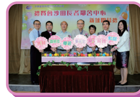
沙田長者鄰舍中心開幕儀式

沙田長者鄰舍中心自2003年成立，於沙田第一城服務接近15年，為區內的長者提供優質的服務。但由於第一城的會址空間不符合鄰舍中心的營運要求，因此中心於2017年11月遷至水泉澳邨，新址有4000呎，為長者提供了充足而舒適的活動空間。中心於2018年5月19日舉行新址開幕禮，當天由社會福利署助理署長陳德義先生、沙田區區議會主席何厚祥先生及房屋事務經理馬耀池先生擔任主禮嘉賓，出席嘉賓超過90多位，一同支持中心展開新一頁。